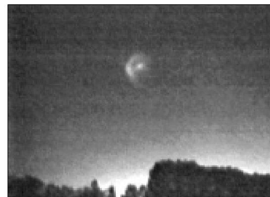
№ 145. На съёмках фильма «НЛО»

Смотрю. В ясном звёздном небе, слева по ходу, висит фиговина - «летающая тарелка» называется. Пока я доставал камеру, вставлял аккумулятор, кассету, она всё висела. Вышел из машины. Стал снимать. Она помаячила несколько секунд в кадре и растворилась в воздухе.