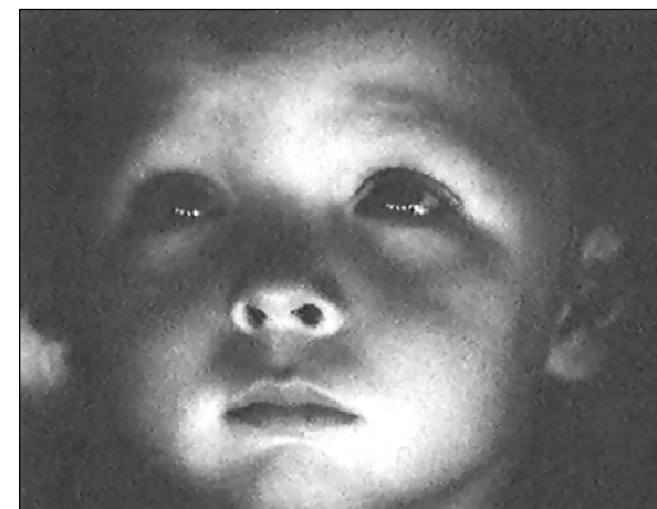
№ 153. Кадр из фильма «Старше на 10 минут»

Не так важно, что снимать. Важнее, как снимать.