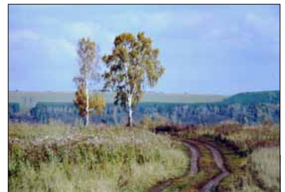
№ 147. Пейзажи снятые в солнечную погод