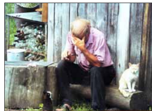
№ 150. Кадры из очерка «Аскатские истории»