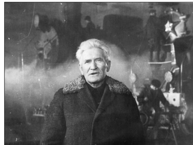
№ 148. Кадр из очерка «Сегодня много лет назад»

Запомнилась мне съёмка с Алексеем Стахановым в Донбассе. Снимали его уже больного, в каком-то профилактории и, как оказалось, это была последняя съёмка знаменитого шахтёра.