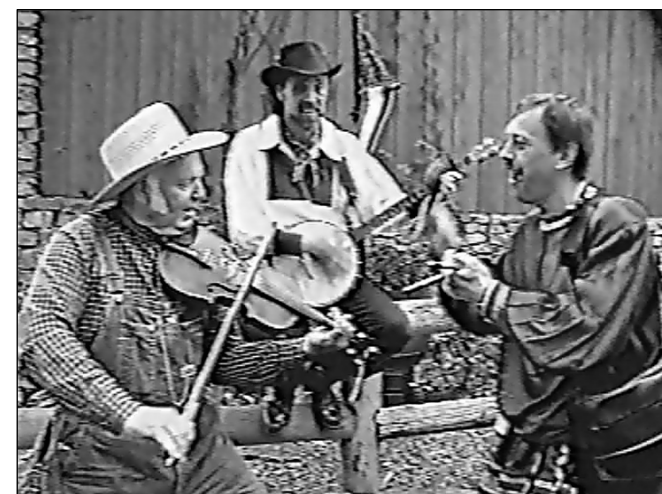
№ 152. Кадр из очерка «Шахтёрский огонёк» в Америке»