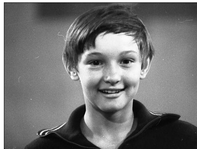
№ 151. Кадр из очерка «Преодолеть себя»