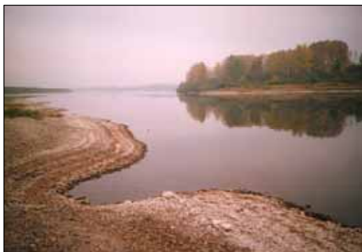
№ 146. Пейзажи снятые в пасмурную погоду