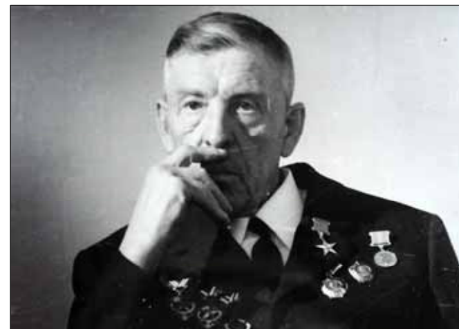
№ 149. Кадр из очерка «Сегодня много лет назад»